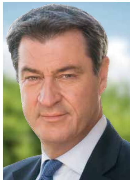
DR. MARKUS SÖDER, MDL VORSITZENDER DER CSU BAYERISCHER MINISTERPRÄSIDENT