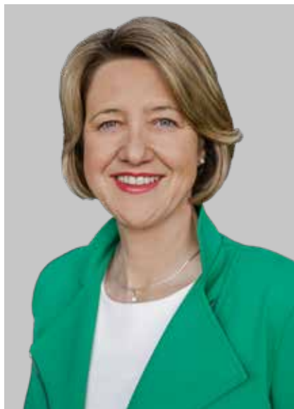
DR. ANJA WEISGERBER, MDB CO-VORSITZENDE DER CSU-GRUNDSATZKOMMISSION