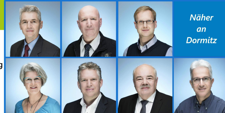
Näher an Dormitz

Die Gemeinde hat auch in der Energiewende eine Vorbildfunktion. Zum strukturierten Vorgehen hierbei gehört die Aufstellung eines Energienutzungsplans, eine Überprüfung der Energieeffizienz der gemeindlichen Einrichtungen und der Ausbau der Photovoltaik auf Gemeindegebäuden, sowie mittelfristig die Umstellung auf CO 2 -neutrale Heizungen.