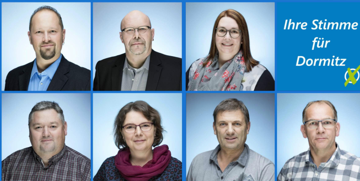
Ihre Stimme für Dormitz

Ein Kinder- und Jugendparlament soll gewählt und mit Aufgaben ausgestattet werden.