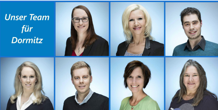
Unser Team für Dormitz