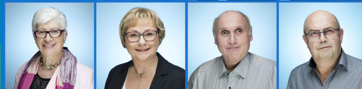
Gemeinsam stark für Dormitz

Die Dormitzer Bürger sollen die Möglichkeit haben, möglichst lange in ihrem vertrauten Umfeld zu leben. Dafür streben wir Mehrgenerationenwohnkonzepte und die Einrichtung barrierefreier Seniorenwohnungen an.